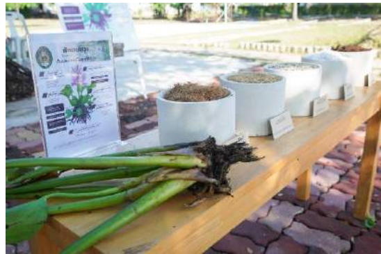
ณ ศูนย์การเรียนรู้และขับเคลื่อนปรัชญาของเศรษฐกิจพอเพียง ตำบลคลองด่าน อำเภอบางบ่อ จังหวัดสมุทรปราการ