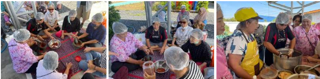
3. มหาวิทยาลัยจัดโครงการพัฒนาคุณภาพชีวิตและยกระดับเศรษฐกิจฐานราก เพื่อการพัฒนาที่ยั่งยืน ตำบลปากน้ำ อำเภอเมืองสมุทรปราการ จังหวัดสมุทรปราการ ระหว่างวันที่ 27 – 29 มีนาคม พ.ศ. 2567 ประกอบด้วย 3 กิจกรรม ดังนี้